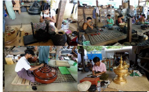
โรงผลิตเครื่องเงิน