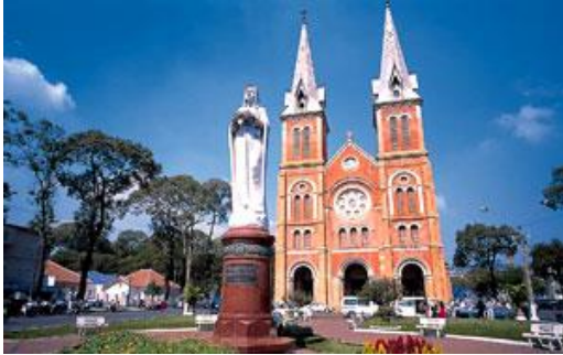
โบสถ์นอร์ทเธอดาม