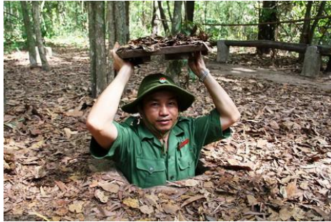
อุโมงค์กู๋จี