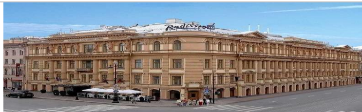
RADISSON ROYAL HOTEL ST.PETERSBURG 5* (3 NIGHTS)