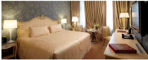
RADISSON ROYAL HOTEL MOSCOW 5* (2 NIGHTS)